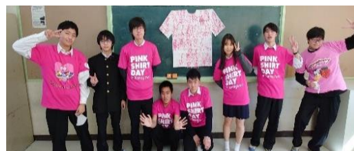
(横浜市立東高等学校サステイナブル研究部)