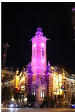
（よこはまコスモワールド）