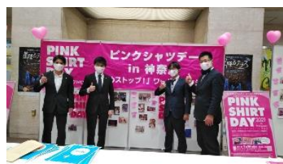
((一社)横浜青年会議所の皆さん)