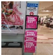
そごう横浜店各階