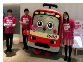
京浜急行電鉄けいきゅん