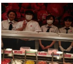
タカナシ乳業店舗