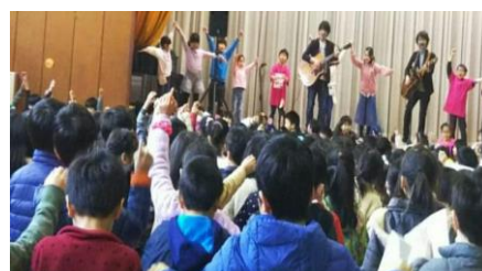
★横浜国立小学校でN.U.ライブ

ちがう国籍。ちがう文化。ちがうファッション・・・。 ちがうことはあたりまえ。ちがうことは大切な個性。 だからこそ、たがいを認め合う神奈川に。共に生きる神奈川に。