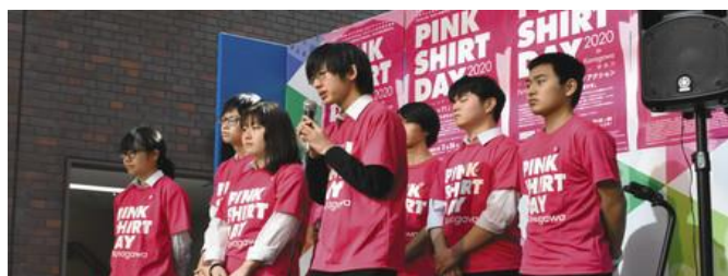
★横浜国立高校生のいじめストップアクション