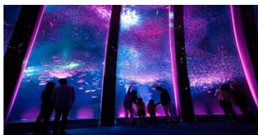
金沢八景島シーパラダイス