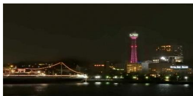
横浜マリントワー

・2019 in 神奈川/2018年9月に推進委員会発足。2019年2月27日（水）横浜駅東口そごう前でメインイベントを開催。また2月をキャンペーン月間とし、告知イベントを開催しました。