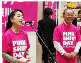
(スペシャル応援トーク)