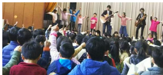
(横浜市立白幡小学校)