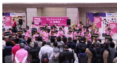
(横浜市立領家中学校吹奏楽部&生徒会)