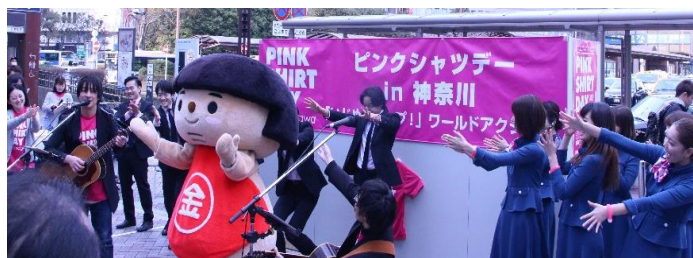
(横浜駅西口横浜高島屋前)