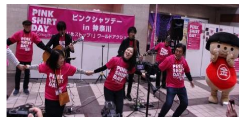
(そごう横浜店地下2階正面入口前)